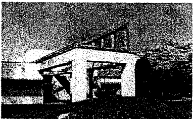
（国立ハンセン病資料館）